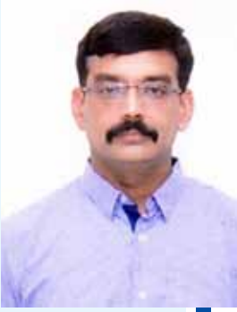
संदीप यादव आयुक्त